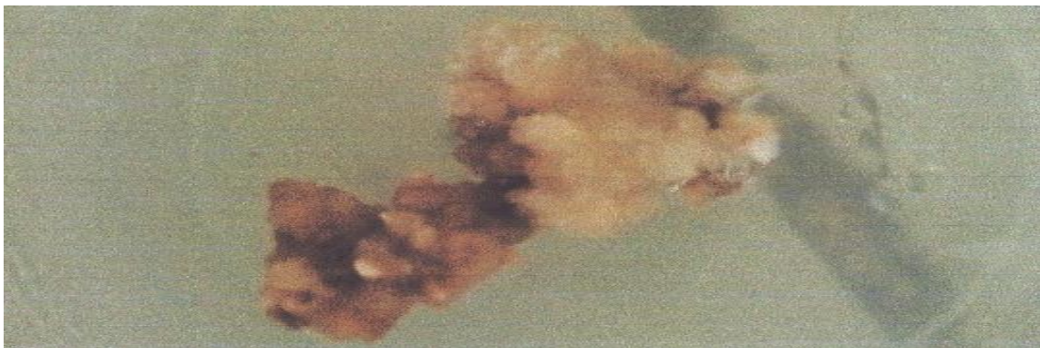
Gambar 2 Bentuk Kalus yang Tumbuh

Menurut Sumadi dan Marianti (2007), hal ini disebabkan oleh adanya siklus sel. Siklus sel adalah pembelahan sel dari satu tahapan ke tahapan pembelahan sel yang lain. Siklus sel sendiri meliputi pertumbuhan massa, duplikasi bahan genetik yang dikenal sebagai interfase, dan pembelahan sel. Interfase meliputi tiga tahap yaitu G1 (periode pertumbuhan), S (sintesis), dan G2 (persiapan pembelahan). Pembelahan sel terdiri dari dua tahap yaitu kariokinesis dan sitokinesis. Tahap kariokinesis (siklus kromosom) merupakan tahap pembagian bahan genetik, sedangkan sitokinesis (siklus sitoplasma) merupakan tahap pembagian sitoplasma.